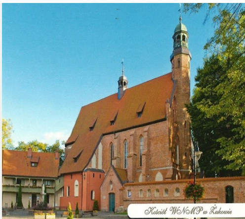
Kościół NMP w Żukowie

Zwiedzanie kościoła i muzeum Niedziela, 26.02.2023 r. Zbiórka: Żukowo, Plac Mariacki (przed kościołem) Start, 14:00