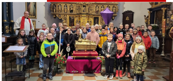
SPOTKANIE DZIECI KOMUNIJNYCH ZE ŚW. WOJCIECHEM