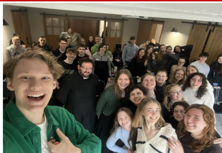
REKOLEKCJE DLA BIERZMOWANYCH