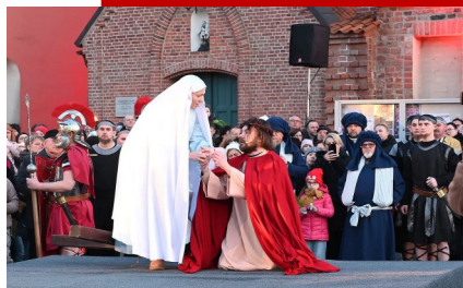
X MISTERIUM MĘKI PAŃSKIEJ NIEDZIELA PALMOWA 224