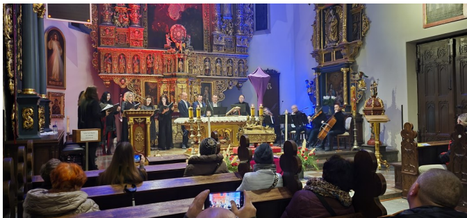
KONCERT PIĘŚNI PASYJNYCH W WYKONANIU SCHOLI NORBERTANKI PRZY RELIKWIACH ŚW. WOJCIECHEM