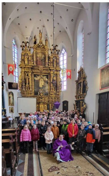
REKOLEKCJE WIELKOPOSTNE DLA DZIECI