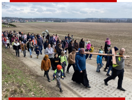
EKSTREMALNA DROGA KRZYŻOWA DLA DZIECI