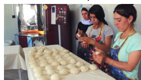
Piekarnia w Iraku otwarta