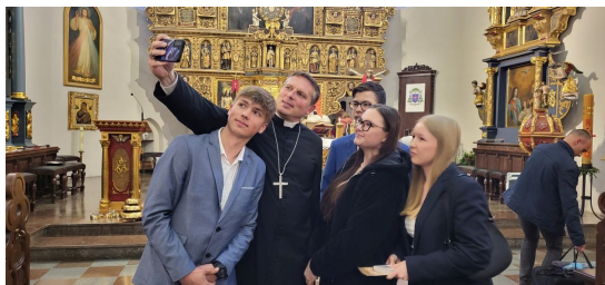
FOTO Z BIERZMOWANIA