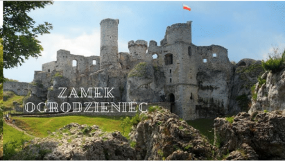
OJCOWSKI PARK NARODOWY